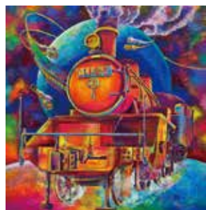
第47回全国総合文化祭 美術・工芸部門（平面） 「幾多の人の夢を乗せて」 47回生 中島瑞稀